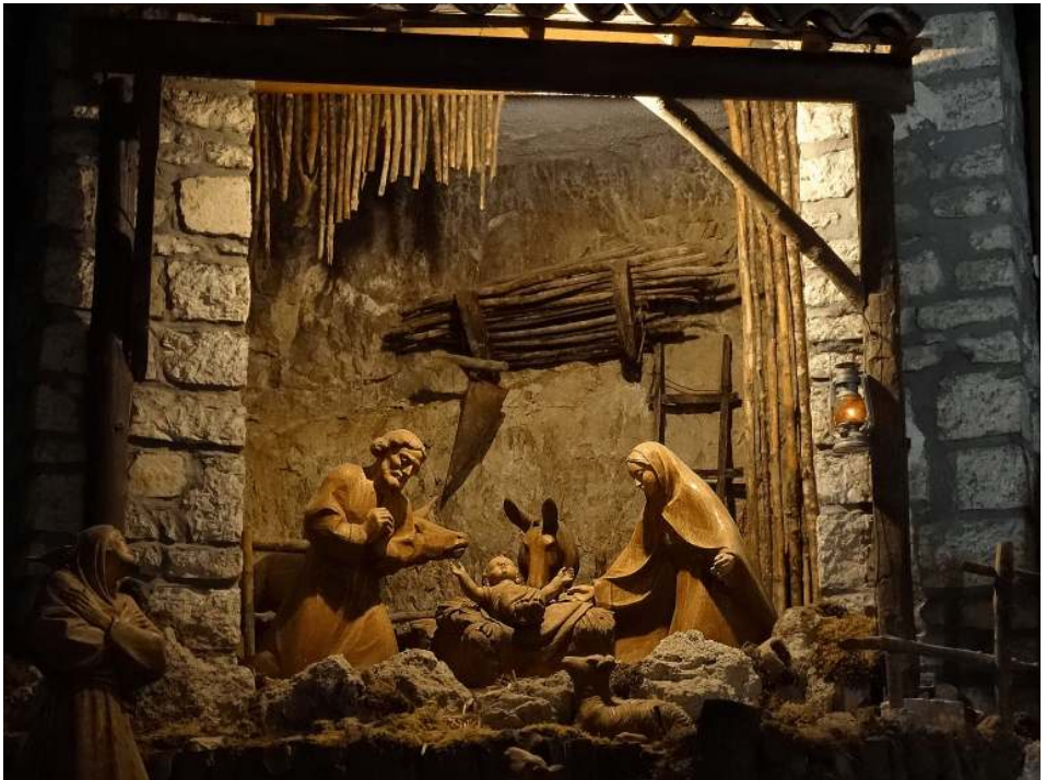
Krippe in der Kirche "Santuario Franceseano del Presepe" bei Greccio/Italien

... Friede auf Erden und den Menschen ein Wohlgefallen