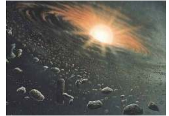
Buch Genesis 1. Kapitel

Vortrag "Nach halb acht" 5. April 2019 19:30 Uhr